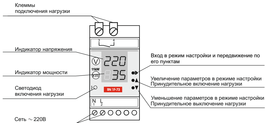
Рис. 1. Устройство прибора

ВНИМАНИЕ! При скачкообразном превышении мощности более 30% от установленного значения, независимо от времени t_1 произойдет отключение исполнительного реле через 0,1 сек.